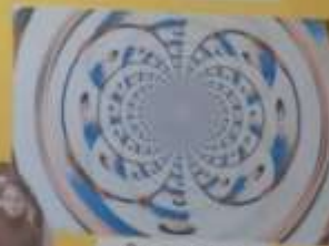
Pero u cvijetu