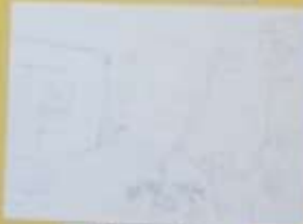
Robert u stripu